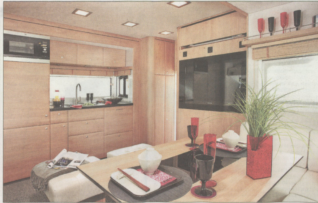
Schickes Innenleben: Der Kunde bestimmt, wie das Interieur der Wohnmobile aussieht.